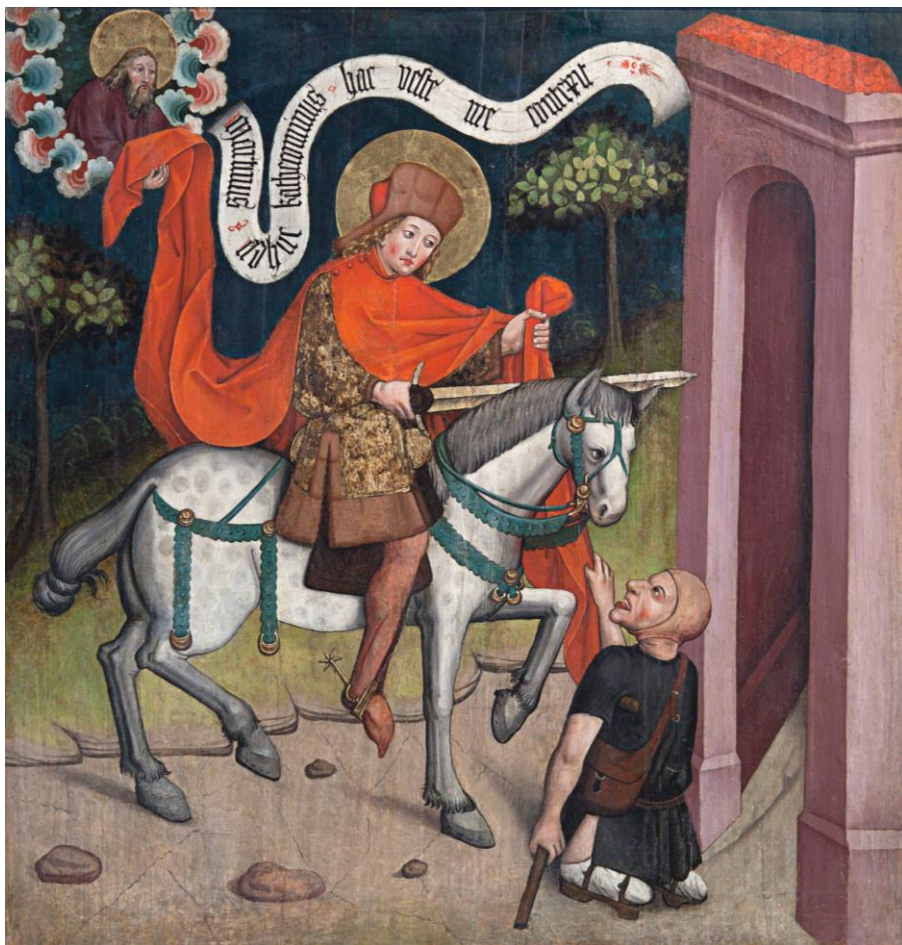
Der Heilige Martin teilt seinen Mantel mit dem Bettler Tafelbild entstanden um 1460 im Bodenseeraum für die St. Martin Kirche in Günzburg, heute im Diözesanmuseum Rottenburg