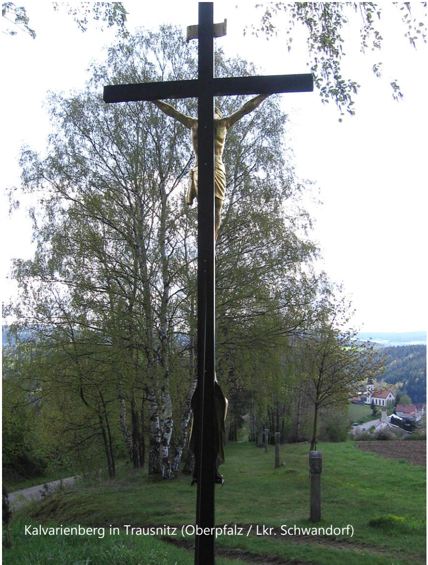
Kalvarienberg in Trausnitz (Oberpfalz / Lkr. Schwandorf)